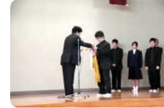
心のこもった千羽鶴