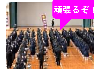
気持ちをひとつに いざ、出陣