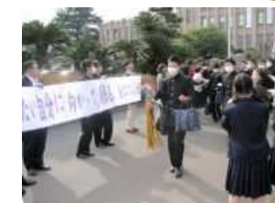
下級生・先生方・保護者の見送り